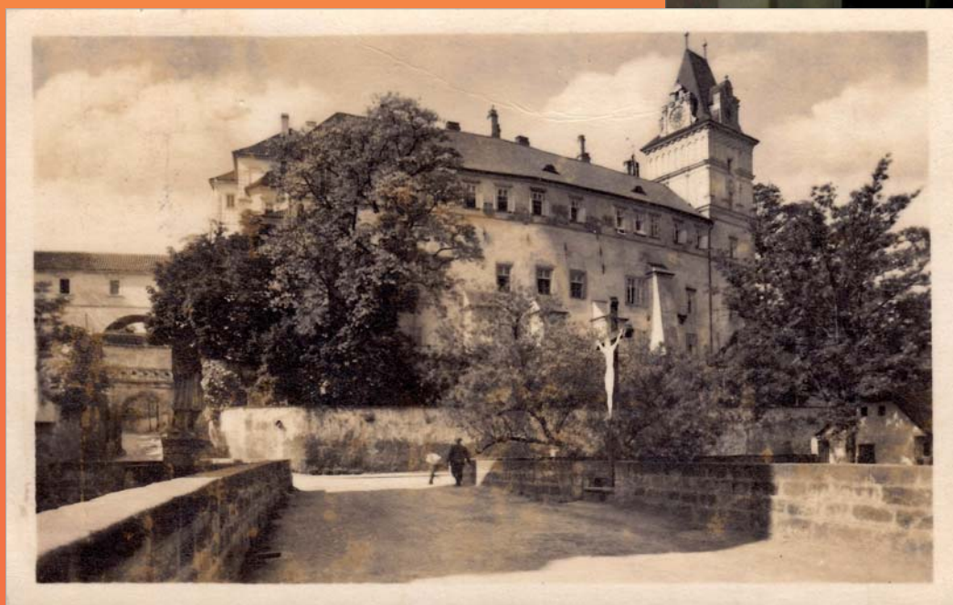
Zámek v Brandýse nad Labem, kde Karel I. Habsburský působil jako voják a který později koupil.