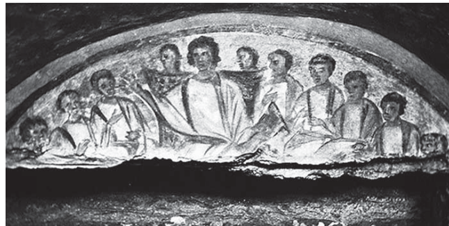
Kristus a apoštolové, 4. stol., Domitiliny katakomby

Abstrakt: Die Vorstellung vom Königtum Gottes, die Israel religionsgeschichtlich vorgegeben war, entwickelte sich seit dem 8./7. Jh. v. Chr. zu einem der grundlegenden Gottesbilder des Alten und Neuen Testaments. Drei Motive bestimmen diese Vorstellung: Der Königsgott hat sich auf den Thron seines Heiligtums (Zion) gesetzt, er ist der Schöpfer der Welt und zugleich der Retter der Armen und Schwachen. Bei den Synoptikern nimmt die Rede von der Gottesherrschaft einen bedeutenden Raum ein. Die Herrschaft Gottes ist das Leitwort der Verkündigung und das Herzstück des Wirkens Jesu.