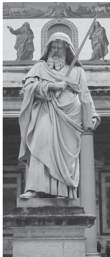
Apoštol národů – svatý Pavel za hradbami

Talmud – sbírka zákonů a náboženských tradic postbiblického judaismu vydaná v písemné formě. Skládá se z Mišny a z jejího komentáře. Podobá se spíše encyklopedii obsahující materiál s různým obsahem v různých literárních formách.