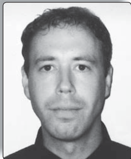
THLIC. MAREK KOZÁK

Článek se týká první evangelizace v rámci působení svatého apoštola Pavla. Vzhledem ke stanovenému rozsahu tohoto článku se chci alespoň dotknout témat, která by nám pomohla Pavlovu evangelizaci přiblížit. Nejdříve se zamyslíme nad židovskou výchovou a židovským výkladem Bible. Poukazuje to na velký rozdíl mezi naší současností a dobou a kulturou, v níž svatý Pavel žil. Dále se zamyslíme nad různými aspekty hlásání evangelia apoštola národů. Je nepochybné, že svatý Pavel, největší křesťanský misionář všech dob, může obohatit i nás v našem evangelizačním poslání.