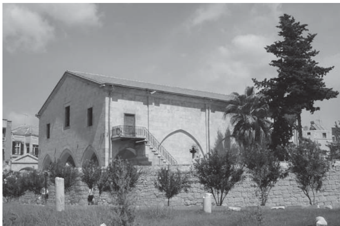
Kostel v Tarsu

etapy. První roky svého života strávil u rodičů v Tarsu, kde se narodil. Důkladnější studium pak získal v Jeruzalémě u vyhlášeného židovského rabína Gamaliela (Sk 22,3). Apoštol Pavel byl tedy vychován podle přísných židovských předpisů. Co to znamenalo? Pokusím se o přiblížení: Traktát Pirke avot z Mišny přikazuje, že každý Žid ve věku pěti let musí začít studovat Bibli. Ve věku deseti let se začíná studovat právní komentář k Bibli, který se jmenuje Mišna. Dosažením věku třinácti let (přesněji dvanácti let a jednoho dne) je Žid považován za dospělého před zákonem, a proto je povinen zachovávat 613 biblických příkazů. Ve věku patnácti let se začíná se studiem Talmudu, který je vlastně komentářem Mišny. V tomto věku začíná takzvané univerzitní studium. Taková byla náboženská formace a vzdělání budoucího apoštola Pavla. Je důležité, abychom si uvědomili,