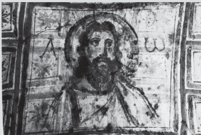
Vyvýšený Pán a Král je cílem našeho pozemského putování. On je „tentýž včera i dnes i na věky“ (Žd 13, 8), „Alfa i Ome-ga, první i poslední, počátek i konec“ (Zj 22,13). Plody jeho vlády jsou „svoboda, řád, klid, svornost a pokoj“, uvádí papež Pius XI. v encyklice Quas primas. Na obrázku je freska ze stropu Commodillíných katakomb.

Slavení této slavnosti v celé církvi zavedl papež Pius XI. v encyklice Quas primas (1925). Papež chtěl potvrdit svrchovanou autoritu Kristovu nad lidmi a institucemi vůči šířícímu se laicizmu v moderní společnosti (souvisí také s hledáním modelu společnosti po První světové válce). Encyklika v úvodu připomíná 1600. výročí zasedání koncilu v Niceji, který vyhlásil nauku o Kristově soupodstatnosti s Otcem, z níž Kristova královská vláda vyplývá.