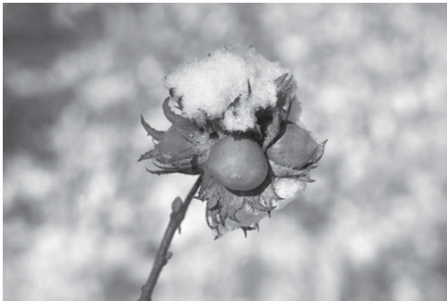
Ilustrační foto: autor článku

Vyprávět o živém Bohu mrtvým jazykem nikam nevede. Slova jako „vykopení“, „zatracení“, „ospravedlnění“, „spása“... jsou pro mnohé „nekonsumovatelným oříškem“. Na druhé straně nevyhnutelně živí víru křesťana. Proto hlasatelé nezbyvá nic jiného, než aby je „louskal“. V tomto článku se budeme věnovat pojmu „spása“.