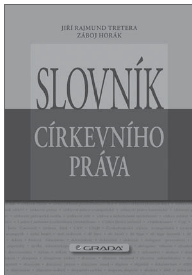
Jiří Raimund TRETERA, Záboj HORÁK: Slovník církevního práva . Grada, Praha 2011, 152 s.

V minulém roce vyšla péčí nakladatelství Grada v edici věnované náboženské problematice relativně útlá publikace Slovník církevního práva . Přesto tato publikace obsahuje přes 1600 hesel, k nimž je podána základní informace o jejich významu, a lze ji proto bez pochybností označit za práci encyklopedického charakteru.