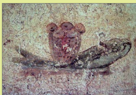
Ryba a koš s pěti chleby, vyobrazení z Luciiny krypty v Kalixtových katakombách v Římě, přelom 2. a 3. století