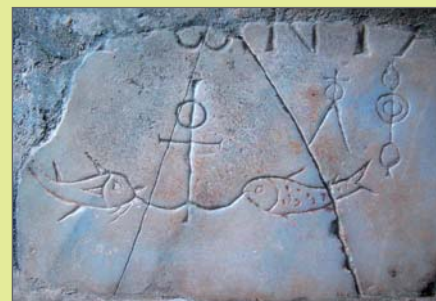
Kotva a ryby na Antoniově epitafu z Domitilíných katakomb v Římě, 3. století

Symbolické zobrazení holubice s olivovou ratolestí je narážka na holubici ohlašující Noemovi konec potopy a předzvěst Božího míru pro svět (Gn 8,10.12). Toto zobrazení může být chápáno rovněž jako znázornění křtu, obecně křesťana zachráněného obmytím vodou z náказы hříchu, a také jako vyjádření míru, který duši člověka poskytuje tato svátost. Na náhrobcích často chápána jako spasená křesťanova duše, která po přestálém utrpení v tomto světě došla do blaženého světa. Olivová ratolest může být nahrazena snítkou vavřínu nebo palmovou ratolestí odkazující na mučednickou korunu zemřelého.