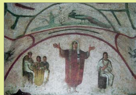
Modlící se žena (orantka), výjev z hrobky zahalené ženy (cubicolo della Velata) v Priscilíných katakombách v Římě, 3. století

Zobrazení člověka s rozepjatými rukama s dlaněmi vzhůru k nebi je známým vyobrazením modlitebního postoje křesťanů. V rané křesťanských pohřebištích (katakombách) obvykle znamená víru ve spasenou duši křesťana směřující k Bohu. V Priscilíných katakombách je uprostřed zobrazena duše zemřelé ženy-vdovy obklopená dvěma dalšími výjevy z jejího života: vlevo uzavřením manželství před biskupem na trůně a vpravo mateřstvím.