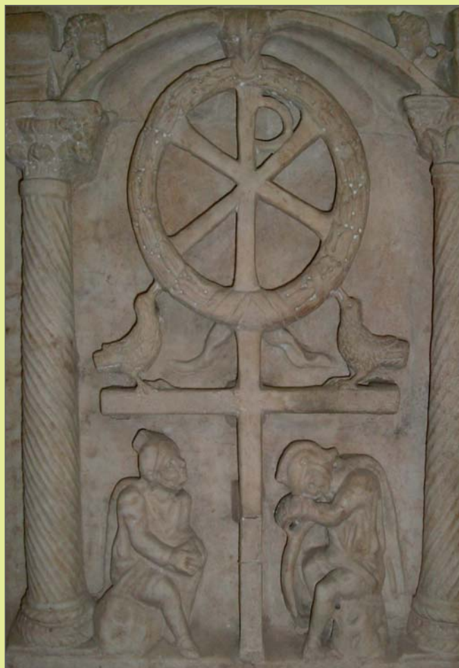
Věnc vítězství, ústřední výjev figurálního náhrobku z Vatikánských muzeí, pol. 4. století.