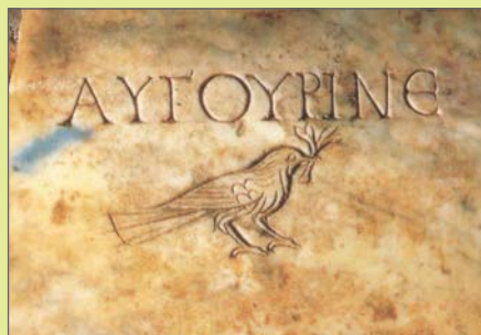
Holubice s olivovou ratolestí na náhrobku Augúriné, konec 3. století

Kotva je odedávna symbolem naděje, jistoty a spásy, protože dává stabilitu lodi na rozbouřeném moři a jistí místo v přístavu. Jistota Božího zaslíbení – „pevné zakotvení v naději“ – zmiňovaná v listě Židům (6,18–19) v narážce na věčný život („jako první z nás vstoupil do nebeské svatyně Ježíš“) je důvodem, proč se symbolické zobrazení kotvy objevuje na mnoha křesťanských náhrobcích, a to nejvíce kolem roku 300, kdy opět zesílilo pronásledování. Tvarově je často stylizována do kříže, symbolu Kristova utrpení, ačkoliv se jinak v těchto dobách samotný symbol kříže nevyskytuje, protože je stále chápán jako potupný popravčí nástroj. Ryby představují věřícího, ale také samotnou eucharistii, tj. zaručený prostředek vedoucí k nesmrtelnosti.