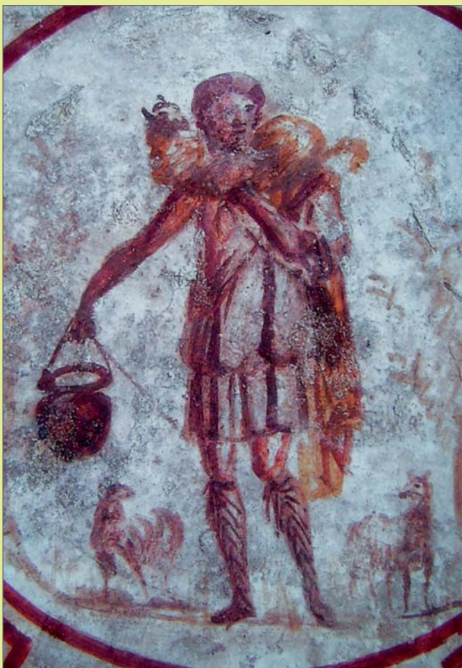
Kristus Dobrý pastýř, detail výzdoby stropu v Luciině kryptě v Kalixtových katakombách v Římě, 3. století.

U většiny původně pasteveckých národů má postava pastýře starajícího se o své stádo rovněž náboženský význam. Ani starý Izrael nebyl výjimkou. Vzpomeňme, na kolika místech Starého zákona se připomíná, že Hospodin je pastýřem svého lidu (za všechny např. slova žalmu 23 „Hospodin je můj pastýř, nic nepostrádám...“)! Sám Ježíš o sobě v Janově evangeliu mluví jako o dobrém pastýři, který „za ovce pokládá svůj život“ (J 10,11). Proto se toto alegorické zobrazení velmi brzy objevuje v křesťanských pohřebištích. V této době měl obraz Dobrého pastýře stejný význam jako znázornění Ukřižovaného pro příští generace. Poselství mladého urostlého pastýře nesoucího na ramenu ztracenou ovci je jednoznačné: Kristus smiřuje hříšníka s Bohem a vrací mu život. Ovce zastupuje duši zemřelého a pastýř je samotným Kristem, který je cestou vedoucí k Bohu. Zobrazení Dobrého pastýře z Kalixtových katakomb prohlubuje symboliku o nádobu s vodou v ruce pastýře, která je odkazem na křest a obecně na svátosti (zvláště eucharistii), slovy Janova evangelia „Kdo se napije vody, kterou mu dám já, nebude žíznit navěky, voda se v něm stane pramenem vody tryskající k věčnému životu“ (J 4,14).