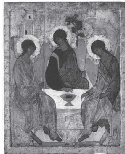
Andrej Rublev: Trojice

Vraťme se ale k působení osob Trojice navenek, jejichž jasnější uchopení nám pak umožní lépe vnímat působení samotného Ducha svatého. Lékem na výše zmíněný neduh západní teologie, tedy na určité vykazování osob Trojice ze stvoření a z dějin spásy, se zdá být ta koncepce, která hovoří o skutečném působení Otce, Syna a Ducha svatého v dějinách spásy, a to tak, že jedná opravdu jednotlivá osoba, vždy však důsledně ve vztazích k ostatním dvěma. Svět tedy vskutku stvořil Otec, ovšem podle Syna a v síle Ducha svatého. Vykoupil nás